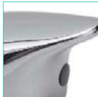
Maneta GOCCIA Cod 21HM5108